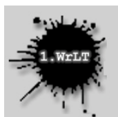
1. wiener lese-theater